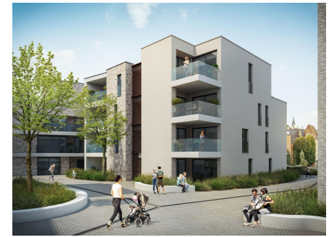
Maalderijstraatje 2, 10, 11, 12 - 2800 Mechelen