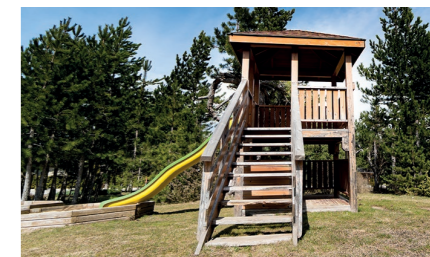
Placer une balançoire