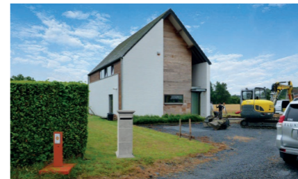
Placer une boîte aux lettres