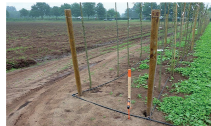
Planter une haie