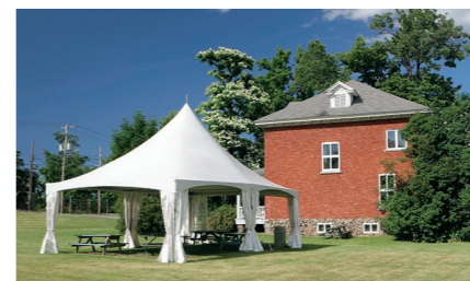
Placer une tonnelle