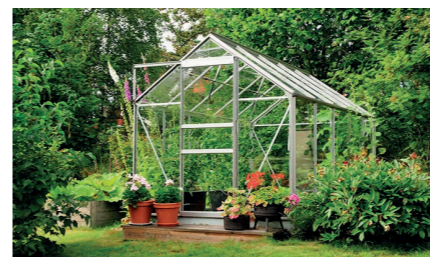
Placer une serre