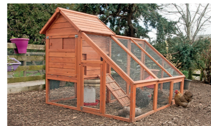
Placer un poulailler