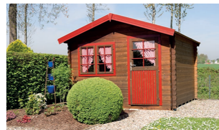
Placer un abri de jardin