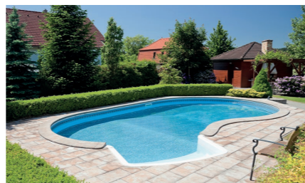
Creuser une piscine