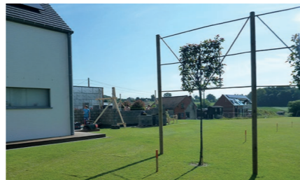
Planter un arbre

Voici quelques exemples de travaux que vous devez signaler. en cas de doute, veuillez contacter le centre d'exploitation régional.