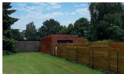
Placer une clôture