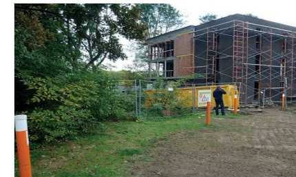
Construire une maison