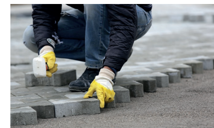
Aménager une terrasse