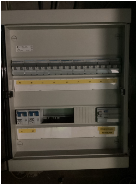
( Elektrisch bord )