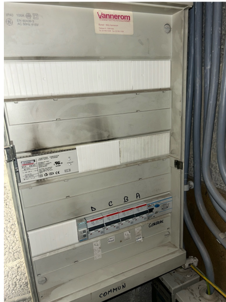
( Tableau électrique )