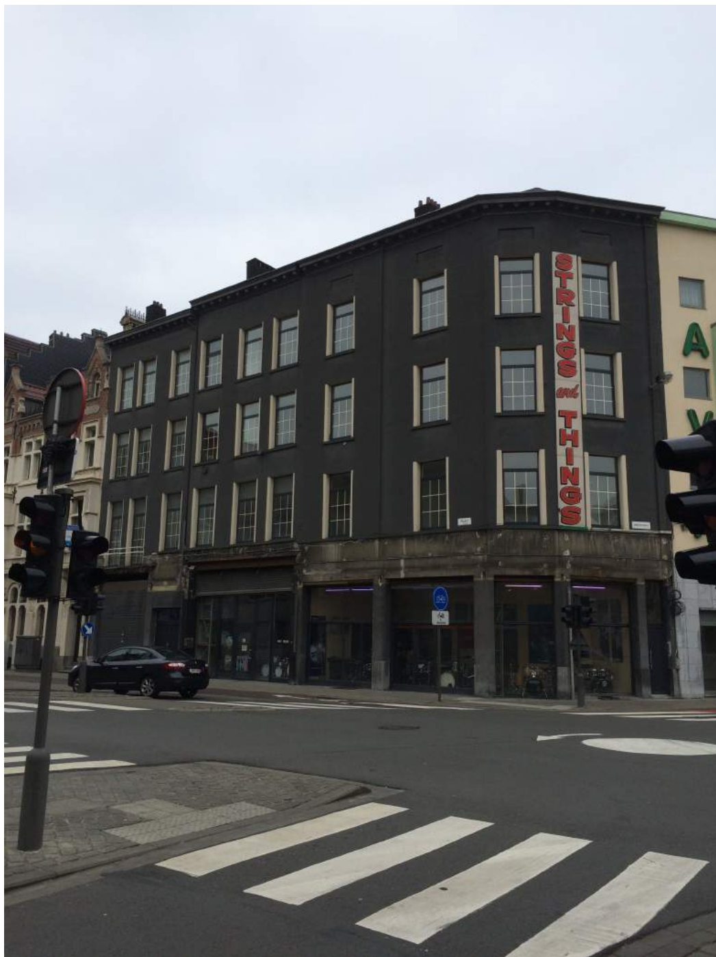
PALEISSTRAAT 100 BUS 02 - 2000 ANTWERPEN