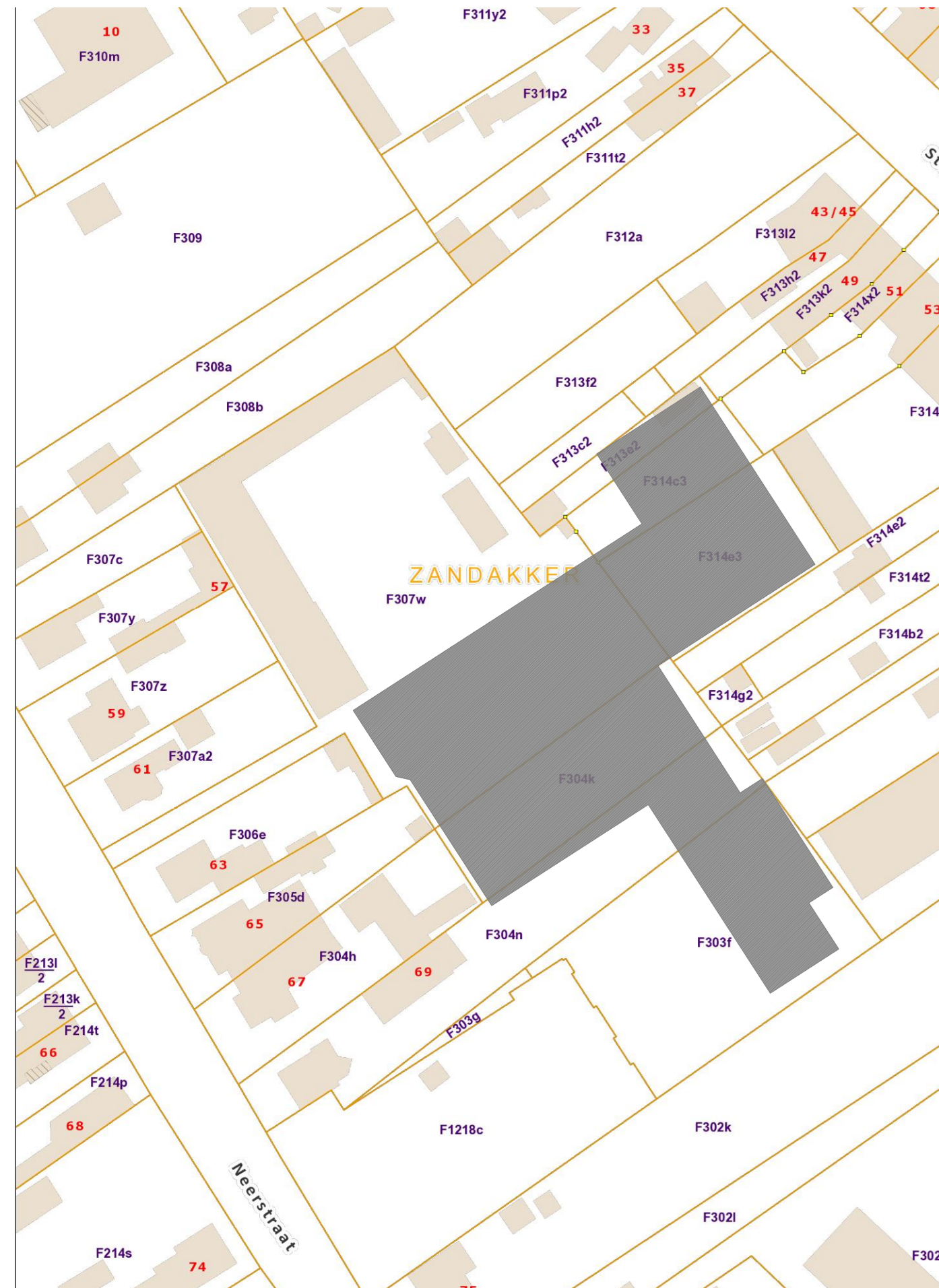
kadasterplan schaal 1/1000

Provincie Antwerpen Gemeente: Oud-Turnhout