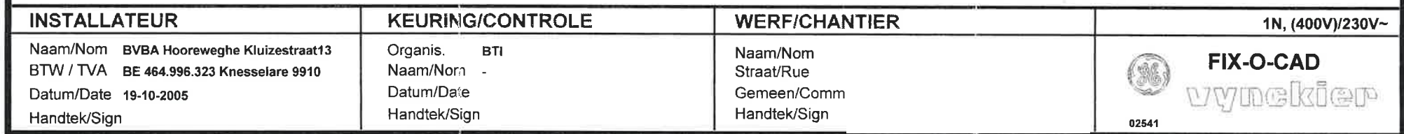
Situatieschema / Schéma de situation