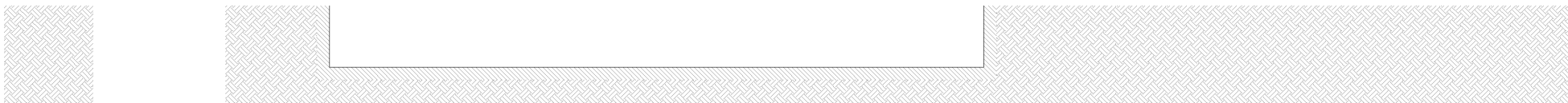
COUPE AA_ 1/50