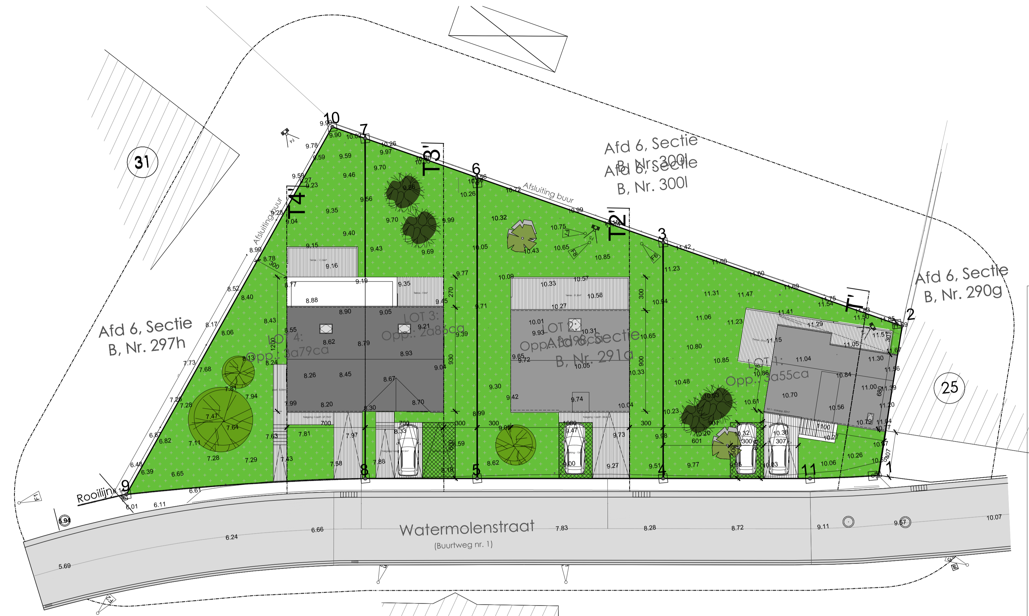
plan INPLANTING 1/200