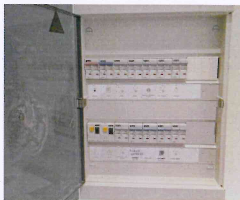
Visualisation de l' installation

ADRESSE DE L'INSTALLATION : Appartement 53 RUE DES PIERRES 4 1000 BRUXELLES PROPRIETAIRE: GRAND CENTRAL PROPERTIES Adresse : LOIXPLEIN 1 1060 BRUXELLES DEMANDEUR : GRAND CENTRAL PROPERTIES Adresse : LOIXPLEIN 1 1060 BRUXELLES INSTALLATEUR : Adresse :