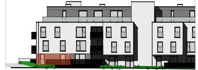
Gevel Brouwerij van Aubelstraat