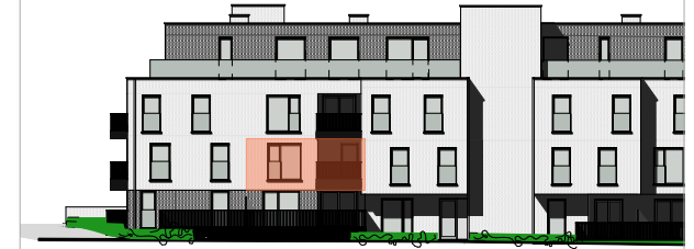
Gevel Brouwerij van Aubelstraat (achter)