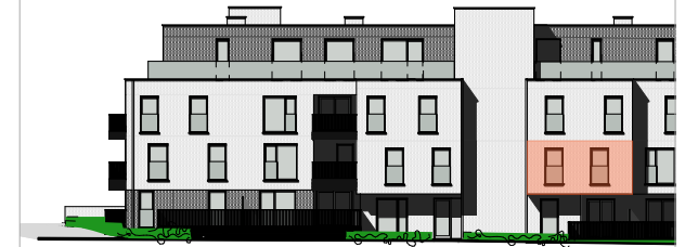
Gevel Spoorwegstraat (achter)