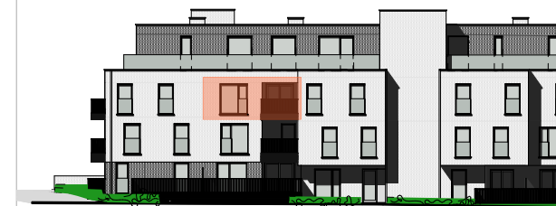
Gevel Brouwerij van Aubelstraat (achter)