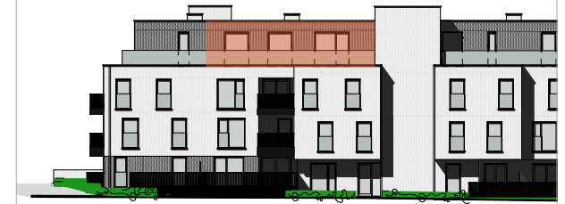
Gevel Spoorwegstraat (achter)