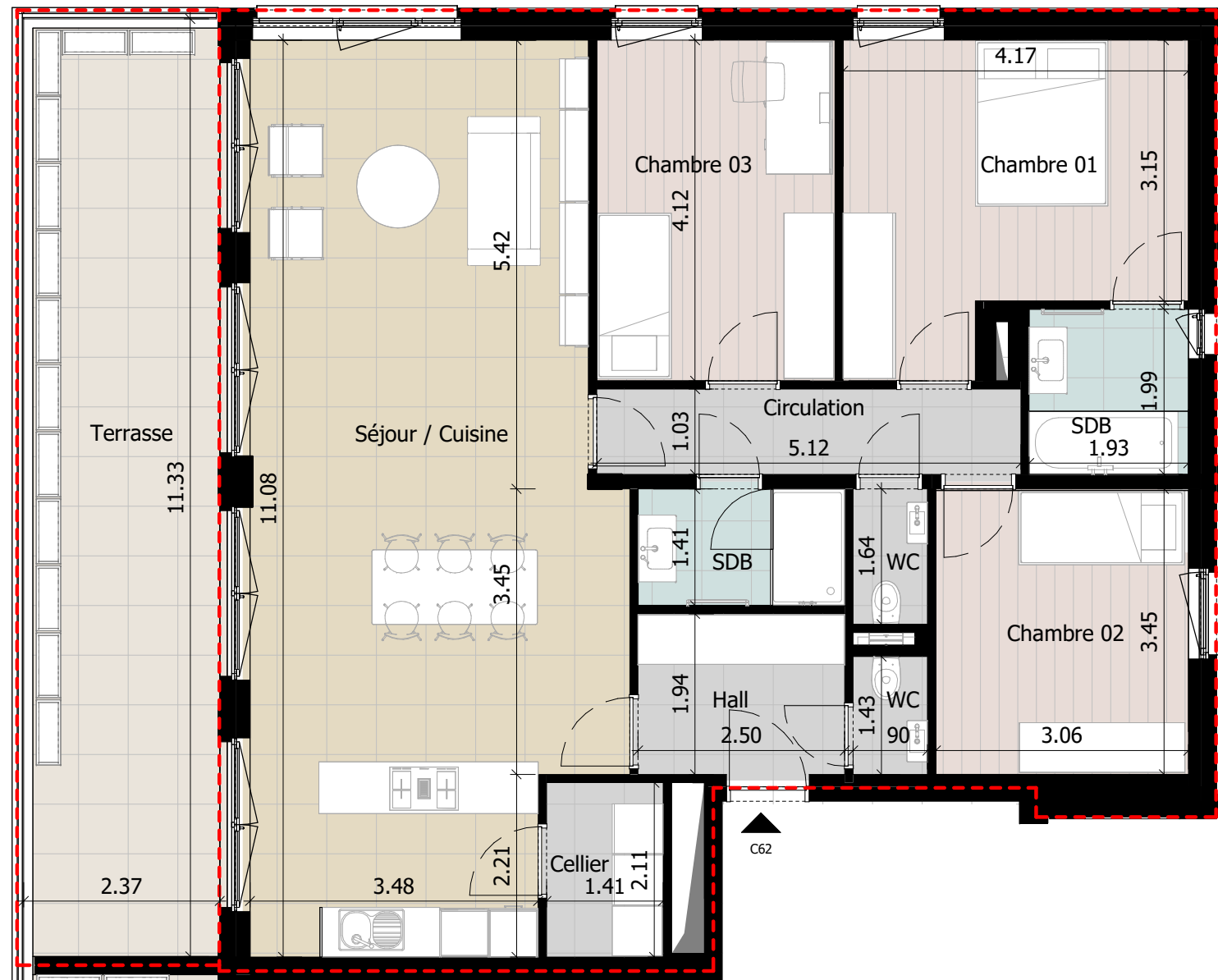
Plan de vente_Appartement C62 Ech: 1 : 75