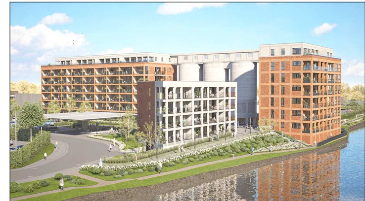
Rue de la Lys, Allée des Princes d'Allain, Tournai