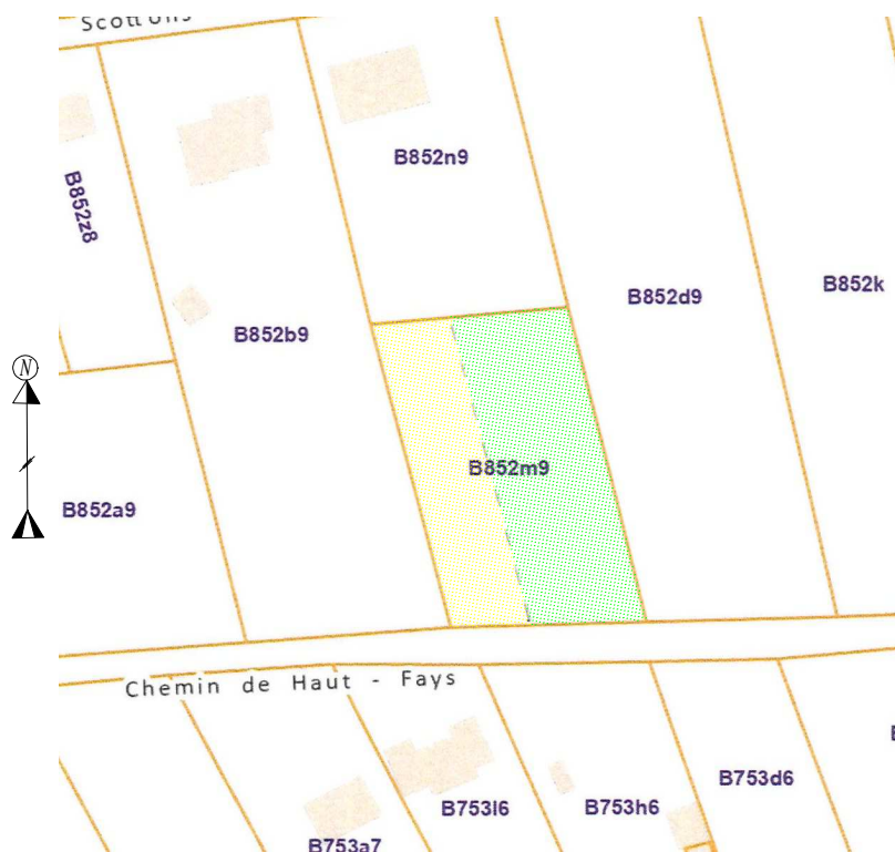
Plan de Situation & de Division Echelle: 1 / 1500

Sous Lot 2 et repris sous liseré vert au plan ci-contre: Terrain cadastré ou ayant été cadastré Section B 852 M 9 partie, d'une contenance mesurée de 12a 14ca, et dont la vente est projetée.