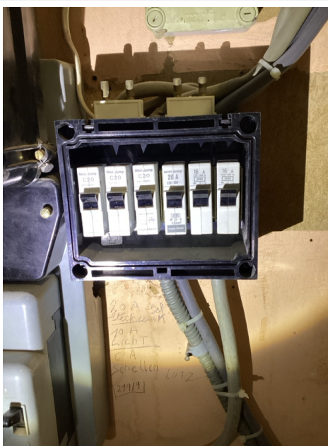
( Tableau électrique )